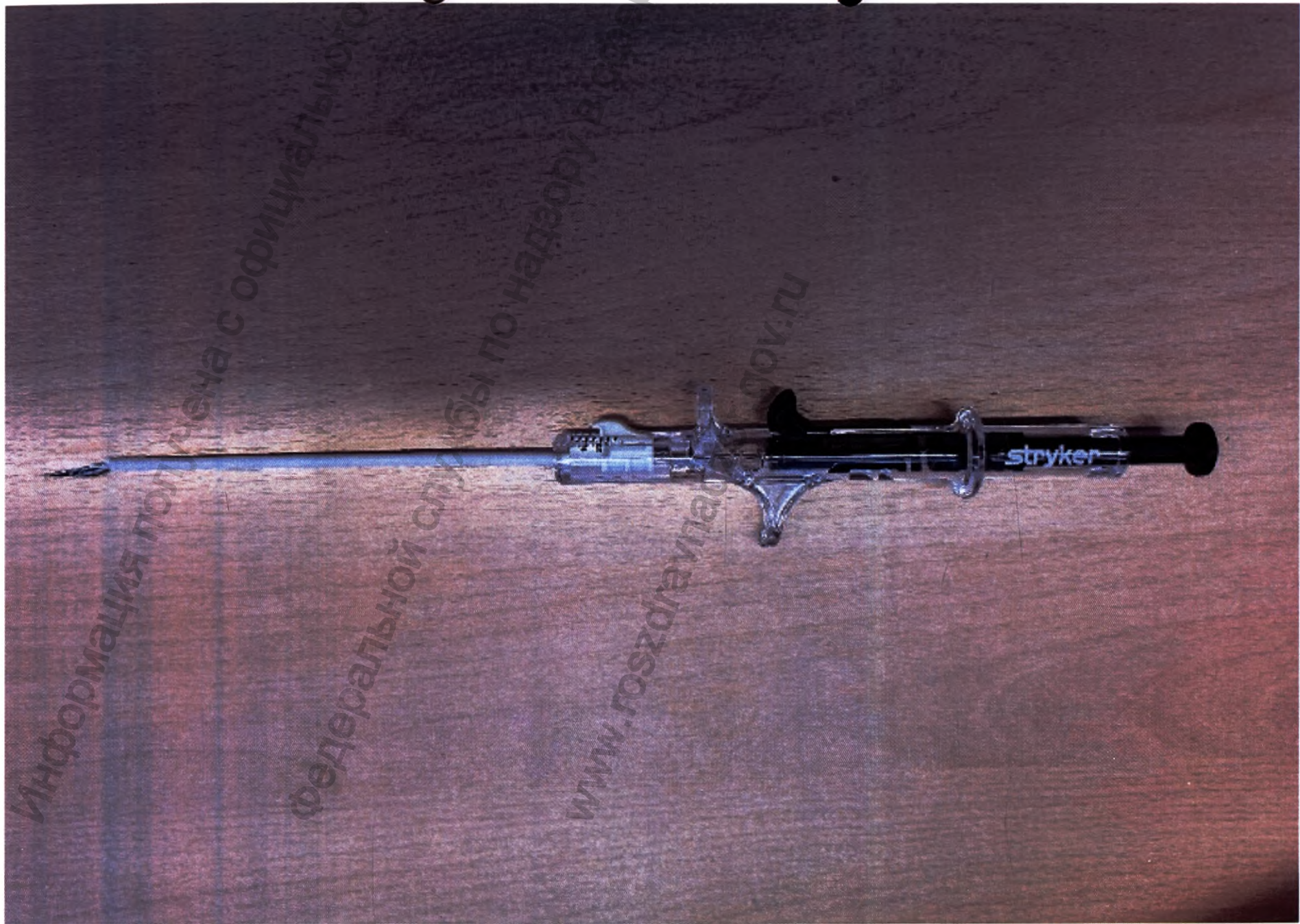
2. Универсальное устройство для восстановления мениска Air+ изогнутое вниз.